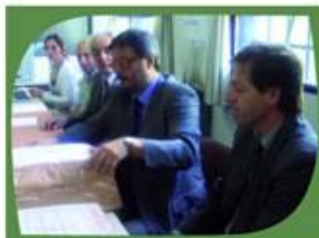
Acto de apertura - licitación de obras.

A través del Programa de Incentivos a la Generación Eléctrica Distribuida, ya en funcionamiento, se está fomentando el desarrollo de proyectos basados preferentemente en energías renovables aprovechando los recursos de biomasa, eólico, solar e hidráulico existentes en