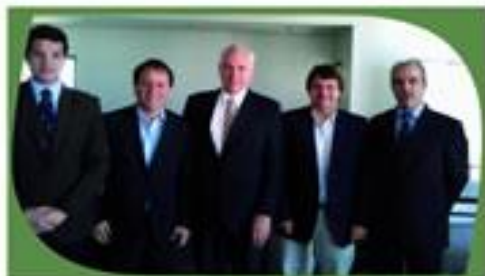
Integrantes de la Comisión Directiva del Freba

El título de esta nota no solo es una sensación que puedo describir en estos momentos, sino también una clara demostración de la realidad que estamos transitando y es por ello, que me permito recordar nuestra historia en el ánimo de contextualizar esta realidad.