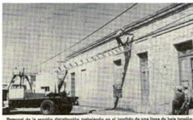
Personal de la sección distribución trabajando en el tendido de una línea de baja tensión.