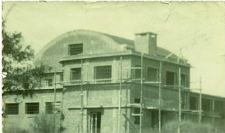
Edificio de la Cooperativa en construcción