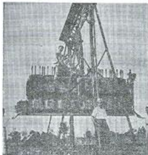
La red griffin registra el instante en que se procede a las tareas de instalación del segundo motor para la usina de Salto, de la Cooperativa Limitada de Consumo de Electricidad.

"Diario La Cooperación" - 24 - feb. - 1957